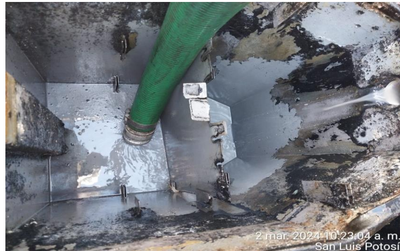
2 mar. 2024 10:23:04 a. m. San Luis Potosí