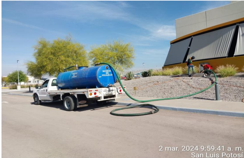
2 mar. 2024 9:59:41 a. m. San Luis Potosí