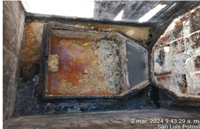
2 mar. 2024 9:43:29 a. m. San Luis Potosí