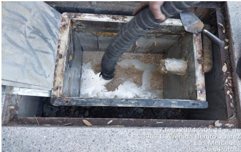
7 feb. 2024 2:05:11 p. m. 3963 C Avenida Benito Juárez Las Mercedes San Luis Potosí